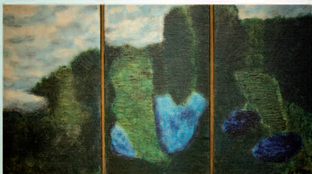
Josef Šíma, Krajina v Auvergne dosažená cena: 2 520 000 Kč